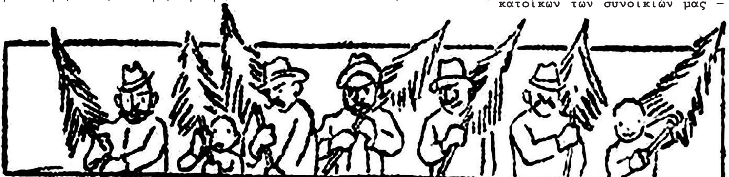
Οι περίοικοι του Λόφου Στρέφη διέσχισαν εν διαδηλώσει τας οδούς φορτωμένοι κομμένα δένδρα. Σκίτσο της εφημερίδας Ελεύθερος Τύπος (18.01.1926).

Η ανάπτυξις του αισθήματος της αλληλεγγύης μεταξύ των κατοίκων των συνοικιών μας -