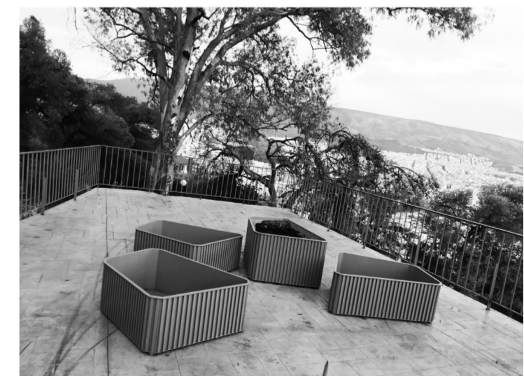
ο νέο βελβεντέρε της καφετέριας -τσιμεντωμένο πλέον- είναι σχεδόν έτοιμο να υποδεχτεί τους πελάτες του. Φωτογραφία άνοιξη 2020.