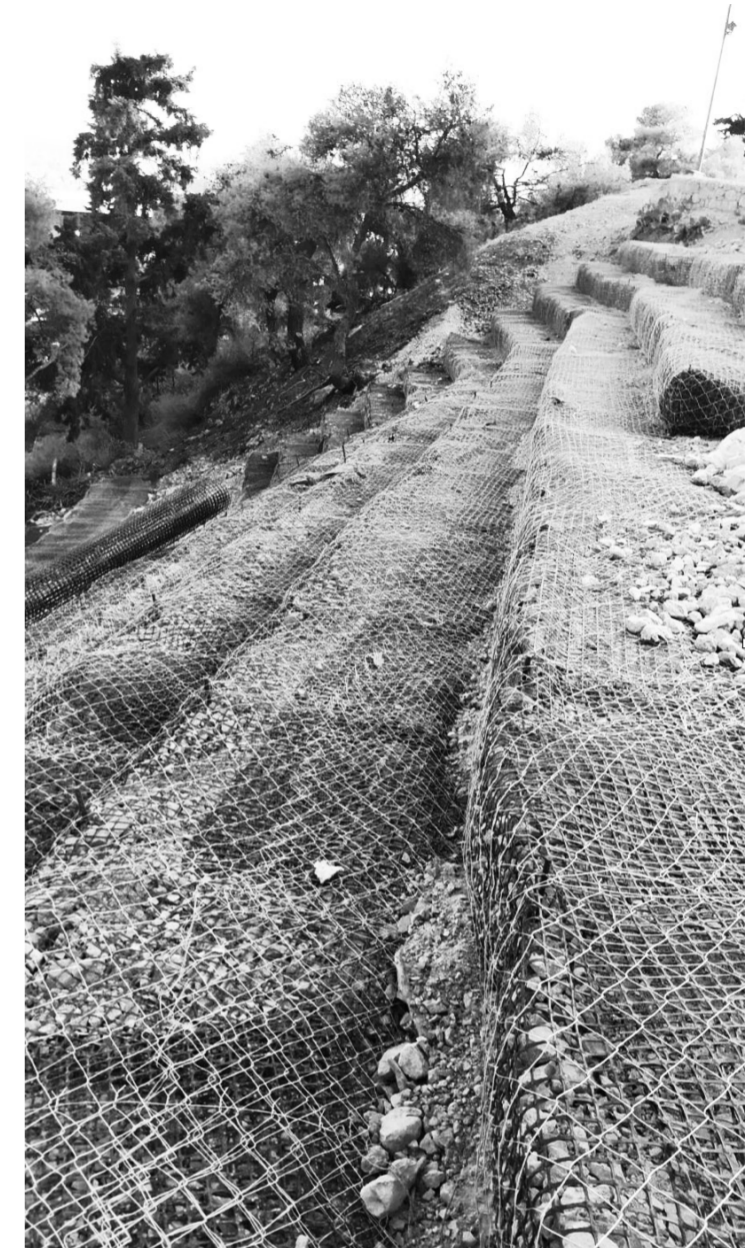
Φωτογραφία απ' το Λυκαβηττό όπου βλέπουμε τον τρόπο συγκράτησης των πρανών με χρήση γεωπλεγμάτων και συρματοκιβωτίων. (01.08.2022)

Όπως και να 'χει, ένα είναι το σίγουρο. Πως όσο αφήνουμε τους δημόσιους και ελεύθερους χώρους απροστάτευτους από τις ορέξεις της Δημοτικής Αρχής Μπακογιάννη, τόσο η επέλαση της «ιδιωτικής πρωτοβουλίας» θα αφήνει από πίσω της συντριμμια: υλικά, οικονομικά, πολιτικά και ψυχικά. Η υπεράσπισή τους είναι η υποχρέωση και το δικαίωμά μας στην πόλη.