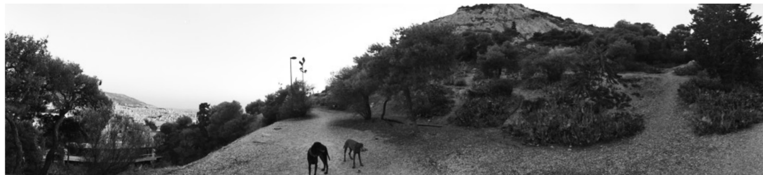
Το ελεύθερο και δημόσιο "μπαλκονάκι" στο λόφο του Λυκαβηττού όπως ήταν πριν το τσιμέντωμα του μονοπατιού και την κατασκευή του νέου εστιατορίου. Φθινόπωρο 2019.

Τα τελευταία τρία χρόνια ο Μπακογιάννης έχει βαλθεί να κλέψει κάθε αγαπημένο μας σημείο σε αυτήν την πόλη! Είτε με τις μπουλντόζες, είτε με τα τραπεζοκαθίσματα έχει βαλθεί να καταπατήσει όσους περισσότερους ελεύθερους χώρους μπορεί για να εξυπηρετήσει τα συμφέροντα των εργολάβων, των κτηματομεσιτικών εταιρειών και των μικρών ή μεγάλων αφεντικών.