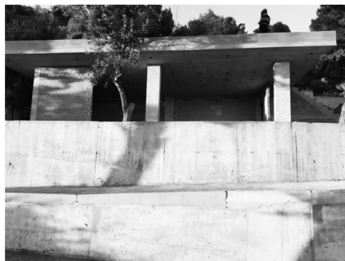
Το νέο εστιατόριο στο μπαλκονάκι του Λυκαβηττού, ενόσω βρισκόταν στα μπετά την άνοιξη του 2020.