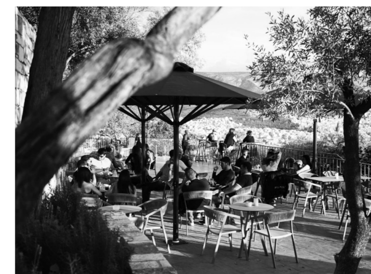
Το ιδιωτικοποιημένο πλέον μπαλκονάκι μετά την ανάπλαση και την κατασκευή του νέου εστιατορίου «Πράσινη Τέντα».