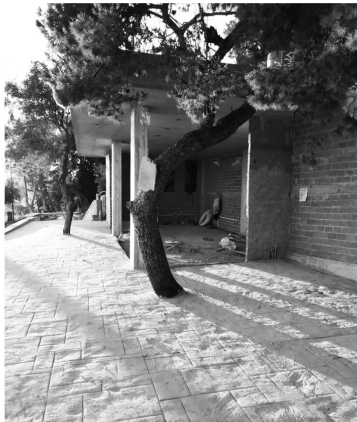
Άλλη μια όψη του υπό κατασκευή εστιατορίου, την άνοιξη του '20.

Μάλιστα είναι τέτοιο το θράσος του ιδιοκτήτη του νέου εστιατορίου «Πράσινη Τέντα», ώστε στο σάιτ του να αυτοαποκαλείται ως «Ένα από τα ιστορικότερα στέκια της Αθήνας», λες και το νέο μαγαζί πρόκειται για κάποιο παλιό εγκαταλελειμμένο κτίσμα το οποίο επαναλειτούργησε, και όχι αυτό που πραγματικά είναι: άλλο ένα δωράκι του Μπακογιάννη στην «ιδιωτική πρωτοβουλία», αποτέλεσμα κλοπής ενός ελεύθερου δημόσιου χώρου. Η ανάπλαση του Λυκαβηττού είναι μια ζωντανή εικόνα από το μέλλον του Στρέφη. Η ανακατασκευή του Βυζαντινού για να λειτουργήσει ως πολυτελές αναψυκτήριο χωρητικότητας μέχρι 100 ατόμων, η κατάληψη του περιβάλλοντος χώρου με